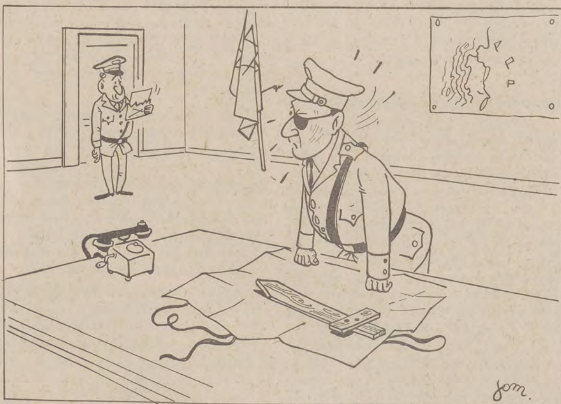
Agentschap TASS: « Indien Israël bereid is voor nieuwe aanval op Egypte, zou Frankrijk hulp bieden ». Joodse Vleugeladjutant: « Hier staat met deze bieden wij onze volledige militaire steun aan ».