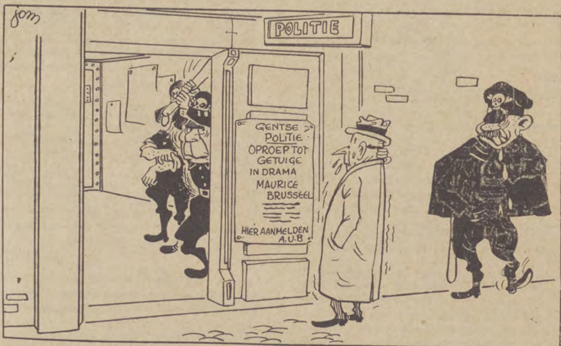
POLITIEDRAMA TE GENT

Wij hopen dat « Het Volk » de moed zal opbrengen haar stellingen te verdedigen, zo niet kunnen we besluiten dat na hun schijnverdediging zij de juistheid van onze stellingen erkent. Wij zullen thans de boeren op de ruimste schaal voorlichten zodat elke boer zijn uitbuiters zal leren kennen.