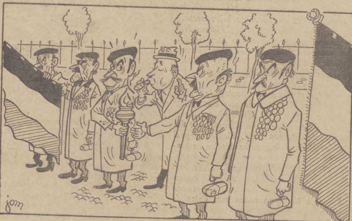
HEILIGE VLAM TE BRUSSEL AANGEKOMEN Toeschouwer : « Mag ik eens even aanroken... dank U ! »