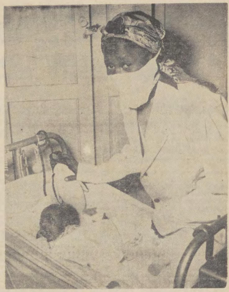
Van onze medewerkers uit Kaapstad