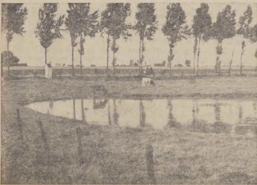
Een wiel, zoals er in de Polders van de kustlanden en nabij de Schelde veel voorkomen. Gewoonlijk ontstonden ze na dijkdoorbraken en overstromingen.

Enmaat in het jaar kijkt gans België naar het Westland. Op de IJzerbedevaartdag leven honderdduizenden in Vlaanderen mee met het steeds ontroerende gebeuren rond het Vlaamse Dodenmonument, terwijl de verlichte geesten van « La Libre Belgique » en « Le Soir » zich met Joseph Dalmelle van « La Revue Nationale » ergeren omdat « les fanatiques pèlerins de la Heldenhulde » weeral eens vergeten zijn dat de IJzer tenslotte een stroom is die uit Frankrijk komt.