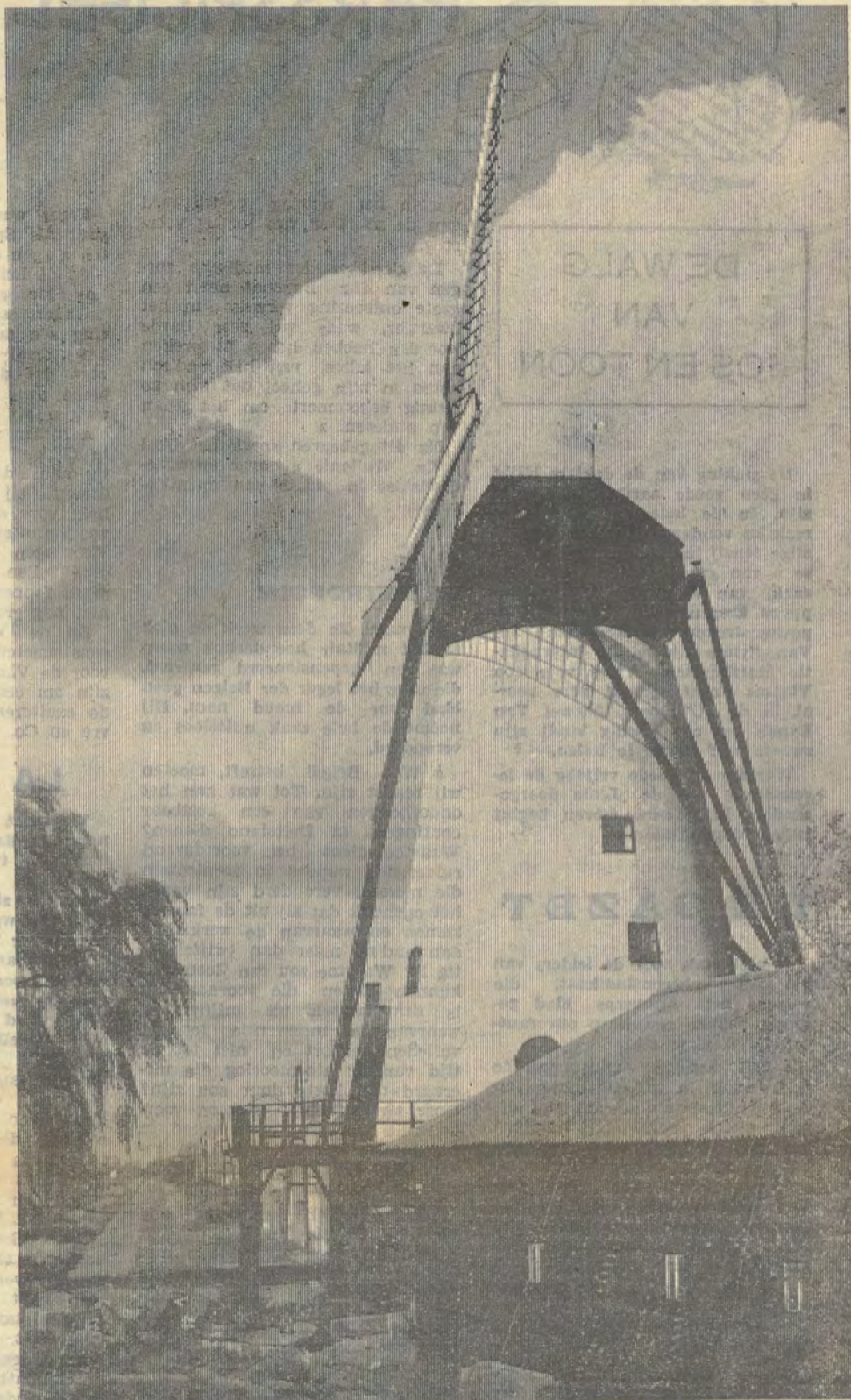
Bedreigd Vlaams patrimonium: de « Eenhoorn » te Lillo. Door de Antwerpse havenuitbreiding wordt deze molen met verdwijning bedreigd. Zal hij gered worden en verplaatst naar het Polders openluchtmuseum?

Hiermee is echter niet alles gezegd over dit boek. Zonder de dithyramben