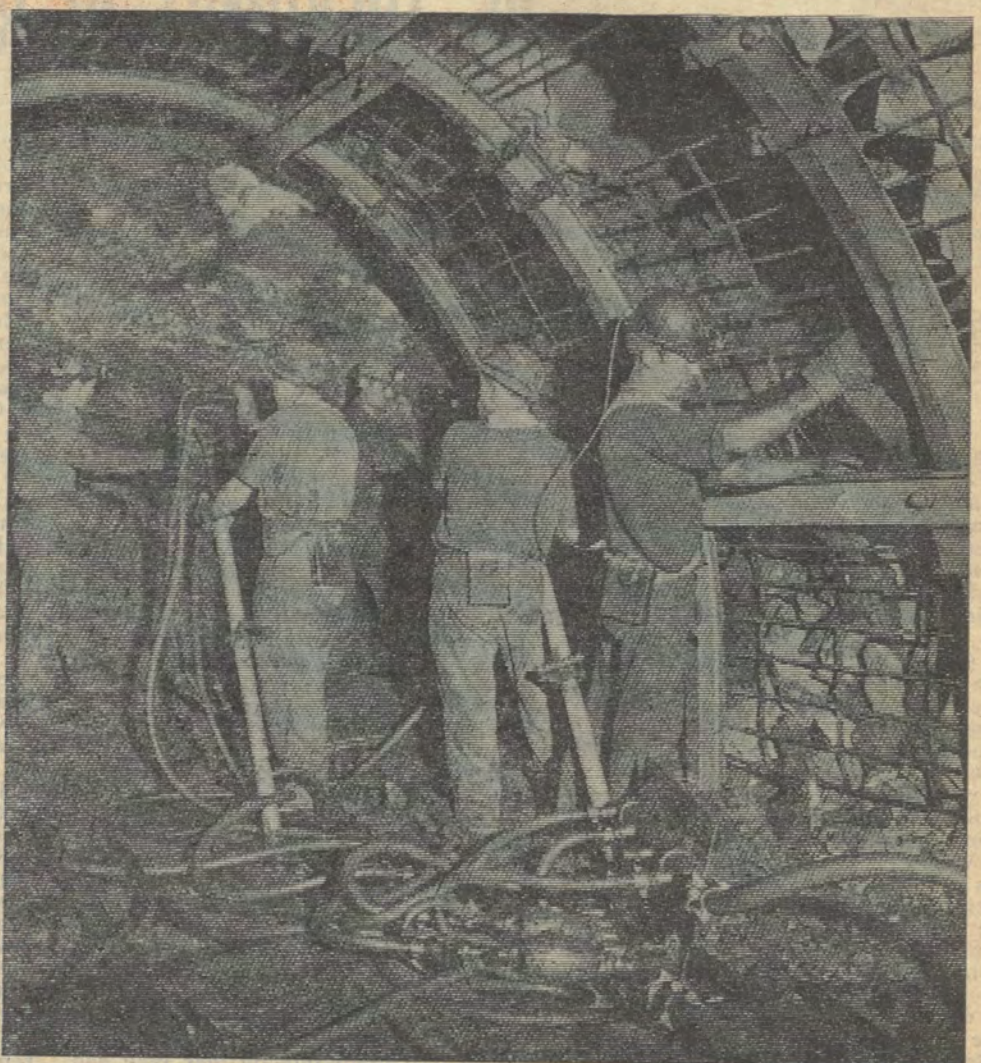
Op de foto bovenaan zien we een hakschaaf aan het werk onder een metalen schoring. Hierboven een beeld in een galerij die geschoord is met betonstukken. Is men in Limburg hier en daar aan moderne middelen toe, dan is dit op sociaal gebied — zoals blijkt uit ons verhaal — niet steeds het geval.