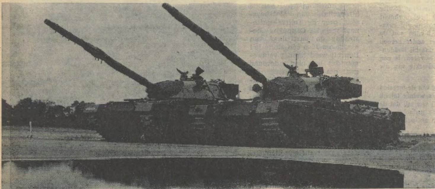
Een der voorgestelde nieuwe Nato-tanktypes : de miljardendans gaat verder...

We kunnen alles niet schrijven over deze zeer gevarieerde miljoenen- en miljardendans. Vooraleer te eindigen met de gewone begroting, moeten we toch nog een woordje zeggen over de zware uitgaven, die het stationneren van strijdkrachten in Duitsland meebrengt. Deze presti-