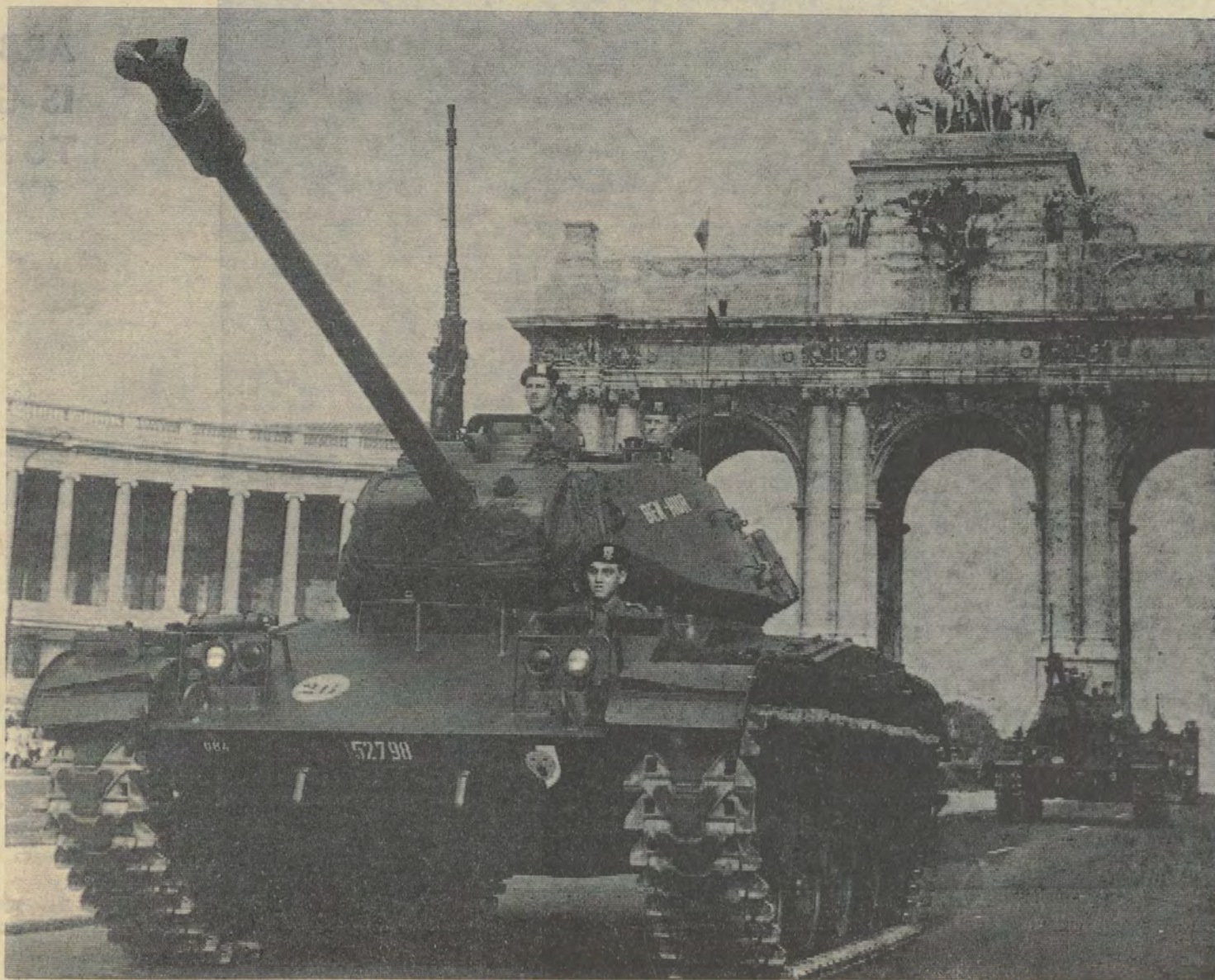
Parade's, oplochten, lijnjes en bureaucratie : het kan nooit op. Het komt loch uit de zak van Honoré Gepluimd

Als ge een beetje bekomen zijt, neem dan nog nota van een laatste peuleschil, nl. de tussenkomst van België in de 14e schijf van de NATO-onderbouw, waarvoor men ons in 1964 vraagt van 408 miljoen te betalen. Elk jaar moet ons land immers 4,24 % betalen van de NATO-werken.