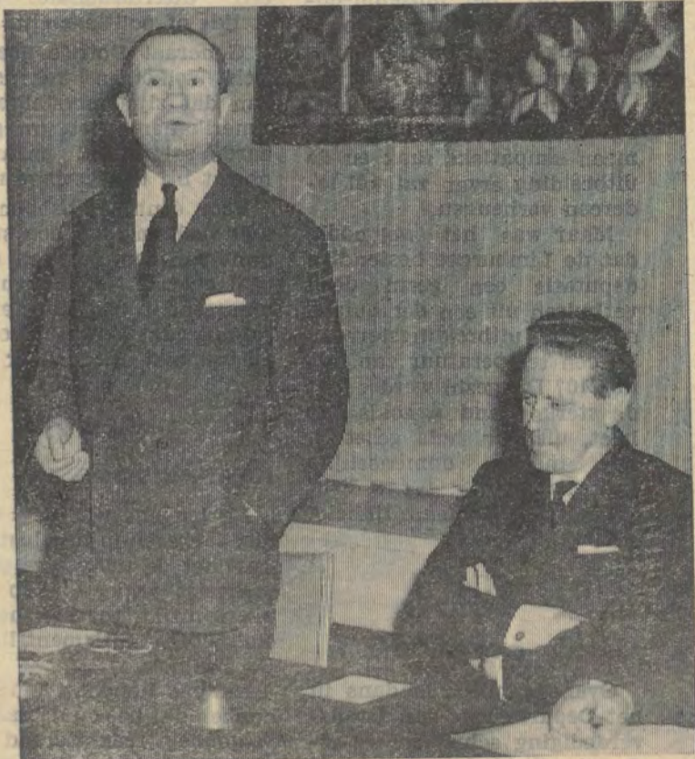
Larock: slecht voorbeeld geven. Van Elslande: zwijgen.

Indien de eerste-minister in alle oprechtheid « neen » heeft geantwoord op de vraag van onze volksvertegenwoordiger, rijst de vraag wie de Paus dan wel heeft verzocht, de T.V.-toespraak te houden en gewag te maken van de « steriele twisten ».