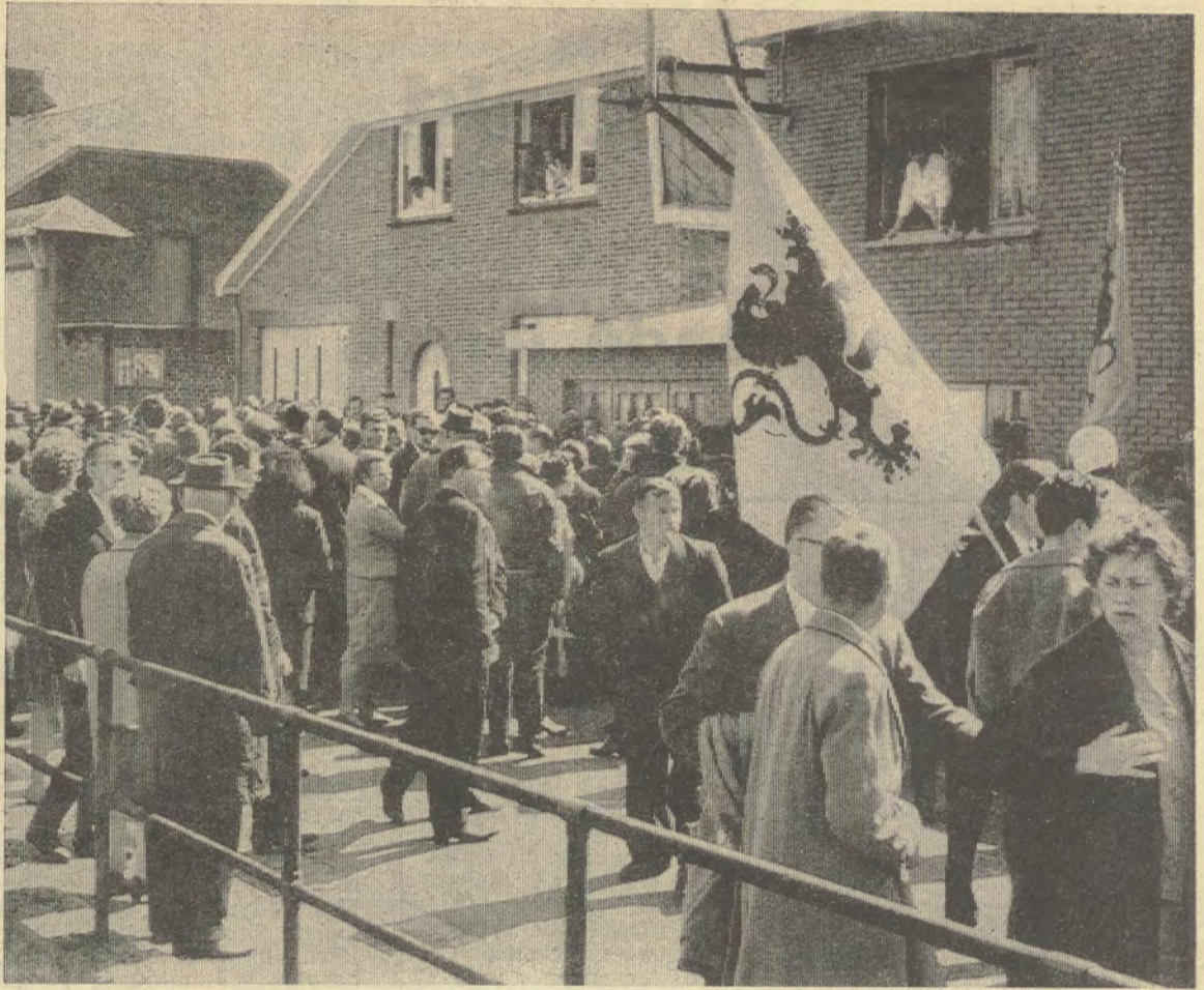
Een beeld uit de oude doos. In 1962-63 stond de anders zo rustige Voerstreek in rep en roer als gevolg van de Waalse agitatie vanuit Luik, waarop dan weer door de Vlamingen met bliksemakties (cfr foto) werd geantwoord. Sinds enkele tijd was de rust in de landelijke Voerstreek weergekeerd. Als het er straks weer woeliger wordt dan zal dit de schuld zijn van eerste-minister Eyskens en de « Vlaamse » pilatussen uit zijn regering. Het toppunt van cynisme is wel dat verzaker Eyskens zijn berucht wetsontwerp-ter-verfransing-van-de-Voerstreek indiende vanuit « een waarachtig verlangen bedaring te brengen »...

Socialisten? Neen, schamteloze profiteurs.