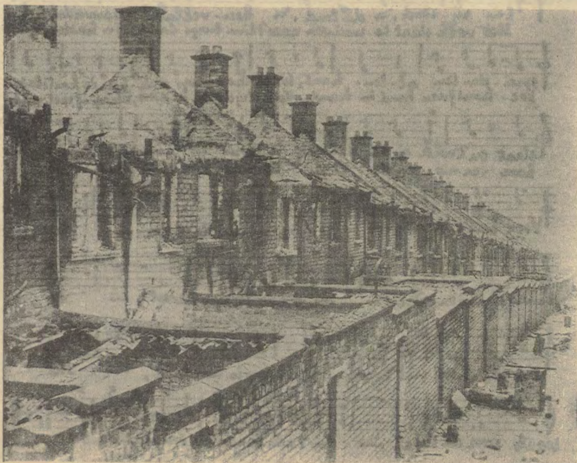
De anders al eentonige huizenrij van Crumlinn Road te Belfast staat er nu doods bij. De bewoners hebben hun huizen in de steek gelaten. De prijs van de zelfstandigheid is hoog...

● In een brief aan Nixon vraagt Roemenië's premier Amerikaanse steun: het wil als belangrijkste handelspartner in Oost-Europa een bijzonder voorrangstatuut verkrijgen. Daarmee bevestigt Roemenië andermaal zijn eigen koers ten opzichte van Moskou.