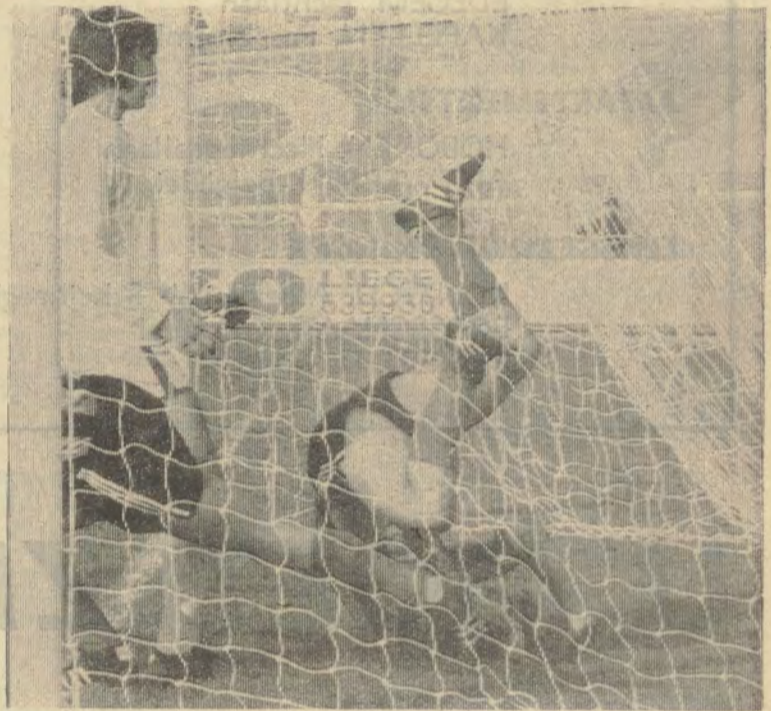
Bal en speler in het doel! De sport kan hard zijn...

den de Noordierse vechthanen niet kunnen wat de Noordierse sporthelden kunnen? Zie, van dat soort redeneringen zouden wij uit ons vel springen. Vervolgens staan ze bij dat gazeteken dat niet dat het een het een is, en het ander het ander? Dat er een enorm verschil is tussen een stelletje profiterende sportidooltjes, op zoek naar een cent en wat gloriol, en een volk dat al eeuwen latent en decennia akuit op zoek is naar politieke zelfstandigheid, godsdienstvrijheid en sociale gerechtigheid? Zien de schrijvers van « Les Sports » dat niet dat er een verschil is tussen wat sportonnozelheid en een uit imperialisme onstane onneidigheid van lijden en tragiek? Als ze dat niet zien, dat ze dan in godsnaam hun mond houden.