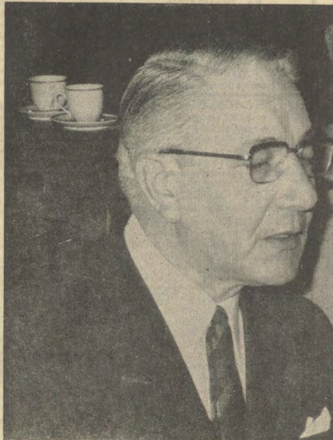
Lucien Harmegnies (BSP) de (Waalse) minister van Binnenlandse Zaken, van wie de Voerstreek rechtstreeks zou afhangen wanneer het speciaal statuut zou goedgekeurd worden en die nu reeds limburgse initiatieven saboteert.