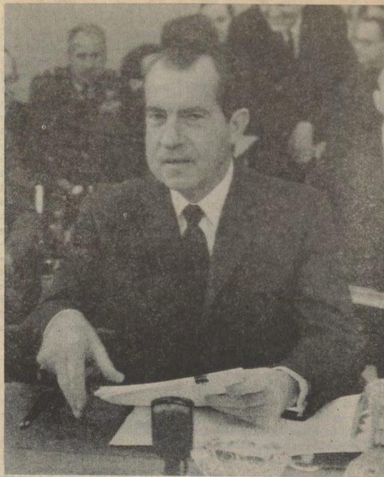
President Nixon : geloofwaardig of niet ?

ter van Justitie Kleindienst zich op het zwijgrecht van de Amerikaanse ambtenaar. Op een direkte vraag van senator Muskie zou hij dat « recht » zelfs uitbreiden tot de 2,5 miljoen ambtenaren die de Amerikaanse burokratie in dienst heeft. Dit was blijkbaar een beetje des Guten zuviel. Zelfs de trouwste aanhangers van Nixon, mannen van de uiterste rechtervleugel van de Republikeinse partij zoals Barry Goldwater, begonnen te steigeren. Ook vice-president Agnew liet door-