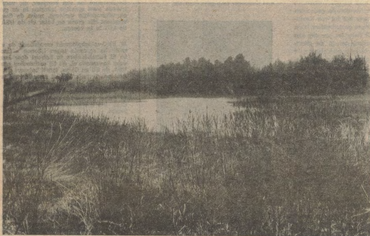
Het Lobelia- en Elatineven te Houthalen

De wijze waarop het tracé van de weg A24 (Brustem-Eindhoven) aan de Limburgers werd opgedrongen heeft in deze groene provincie bitterheid gebracht in de harten van vele natuurliehebbers. Een van hen stuurde ons bijgaand verhelderend stuk over deze aangelegenheid.