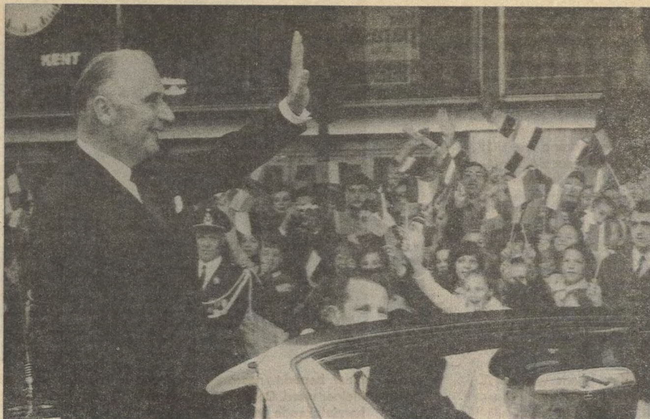
Ook deze centralistische Franse reus op lemen voeten zal eens omvergetrokken worden door de verenigde krachten van de federalistische volksminderheden in Frankrijk.

Het politieke bewustzijn was in Frans-Vlaanderen altijd een stuk achterop in vergelijking met de andere