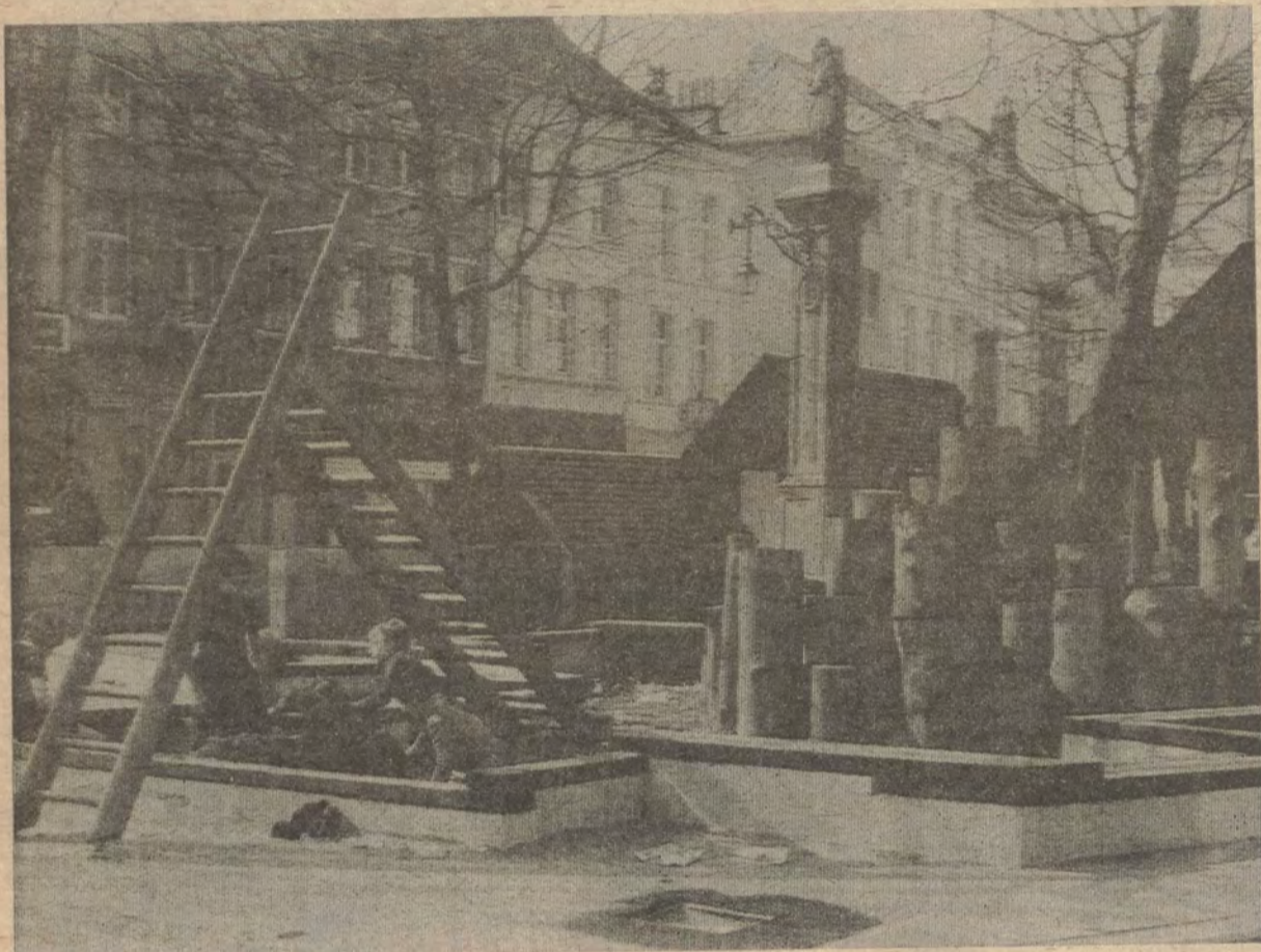
Een veilige inspirerende speeltuin in het midden van de stad, een proeve om het voor stadskinderen wat aangenamer te maken.

In België behoren de meeste diplomaten tot de Frankofone taalgroep. Zou het gemeen zijn te veronderstellen dat hoe gevaarlijker het beroep van diplomaat wordt, hoe meer kans Vlamingen zullen krijgen om deze functie te bekleden?