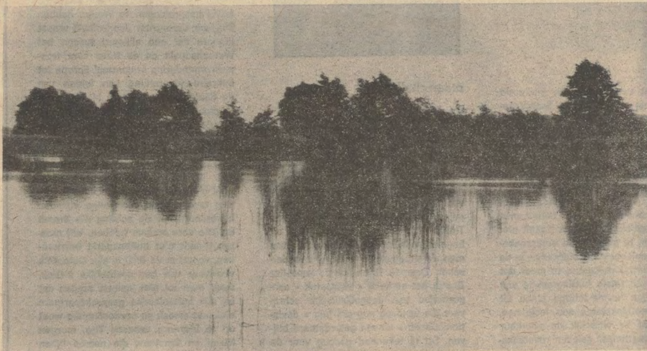
De Borggraevevijvers te Hasselt

Limburg mag zijn helden dankbaar zijn. De initiatiefnemers schitterden door hun gebrek aan inzicht, drang naar profijt en verregaande eigenzinnigheid. Zij zijn echter maar aan het begin van wat als het rasterwerk van het Limburgs wegnest bestempeld wordt. Meer realisaties zullen volgen tenzij vroeg of laat een eind komt aan hun rijk, aan hun alomtegenwoordige heerschappij van in de plaatselijke wielerklub tot in de provinciale universitaire instelling. Het is alleen maar te hopen dat een aantal Limburgers dit gaan inzien.