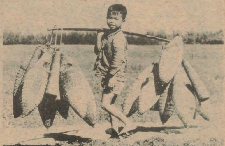
Onze wereld in 1974. De « zwarte vlekken » die bijzonder in de actualiteit stonden (de kaart). De kapotgeschoten stad: ellende, verdriet... In fel contrast: een gezonde jeugd, hoopvolle blik op een vredige toekomst...