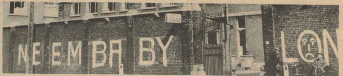
In 1964 zorgden tegenstrevers voor « NEEM Babylon », de VU liet die reuzenletters 2 weken staan en maakte er dan NEEM van !