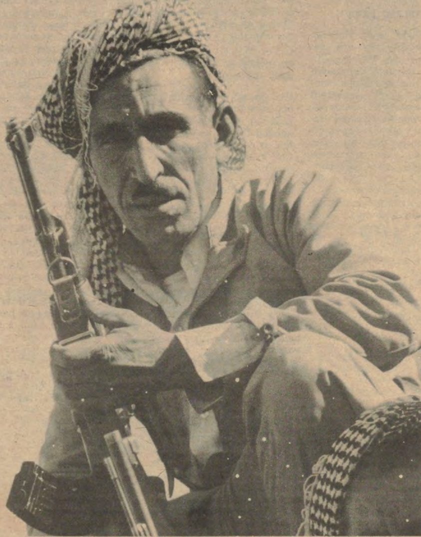
Koerdische soldaten ; je kan ze steeds herkennen, die Koerden, aan hun geruite hoofddoek en hun opbollende donkere kledij — dit in tegenstelling tot de tipische Arabische klederdracht met wijde mantel, tuniek en witte loshangende hoofddoek. Wapens vind je er in elke windstreek, ja, ook FN, wat dacht je soms ?