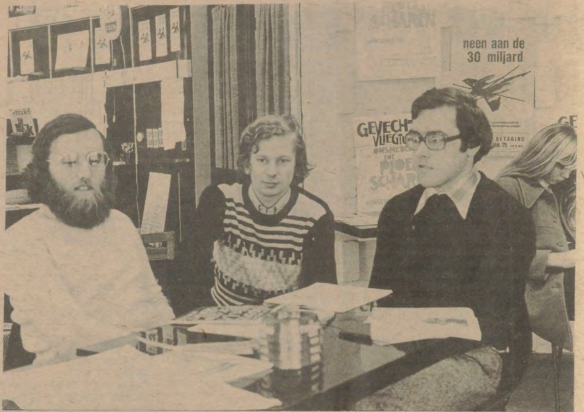
Van Kerstdagmiddag tot Nieuwjaar hielden jonge mensen van Pax Christi-Vlaanderen, Universitaire Parochies, Oxfam-Wereldwinkels, KAJ, SEIN, KSA en VKSJ een hongerstaking in het Pius X kerkje te Desselbergen bij Gent. Hun motivering : « rond Kerstdag en de eindejaarsfeesten komen heel wat mensen tot bezinning. Het verlangen naar een vredevol samenleven wordt even wakker. Zelfs de regering en hooggeplaatste personen spreken van vrede. Maar kan er wel van vrede sprake zijn, op een moment dat de Belgische regering van plan is om 30 miljard frank uit te geven voor nieuwe gevechtsvliegtuigen, en tevens onverschillig blijft tegenover het voedselprobleem en miljoenen met hongersnood bedreigde mensen.

Werk genoeg dus aan de winkel, en een flink deel van dat werk zou in het Jaar van de Vrouw verzet kunnen worden. Maar dan moet de Utrechtse « Emancipade » en wat er verder in het jaar georganiseerd gaat worden, heel wat meer zijn dan een glanzende gebeurtenis waarbij de Nederlandse vrouw op een voetstuk wordt geplaatst. Het nieuwe jaar is ook wel het jaar van het Monument, maar we kunnen die dingen toch maar beter uit elkaar houden. Want bij een monument gaat het om het verleden, terwijl het bij de vrouw, uw vrouw, mijn vrouw, alle vrouwen, heel nadrukkelijk om de toekomst gaat. Zullen we toch maar zeggen : leve 1975, het Jaar van de Vrouw ?