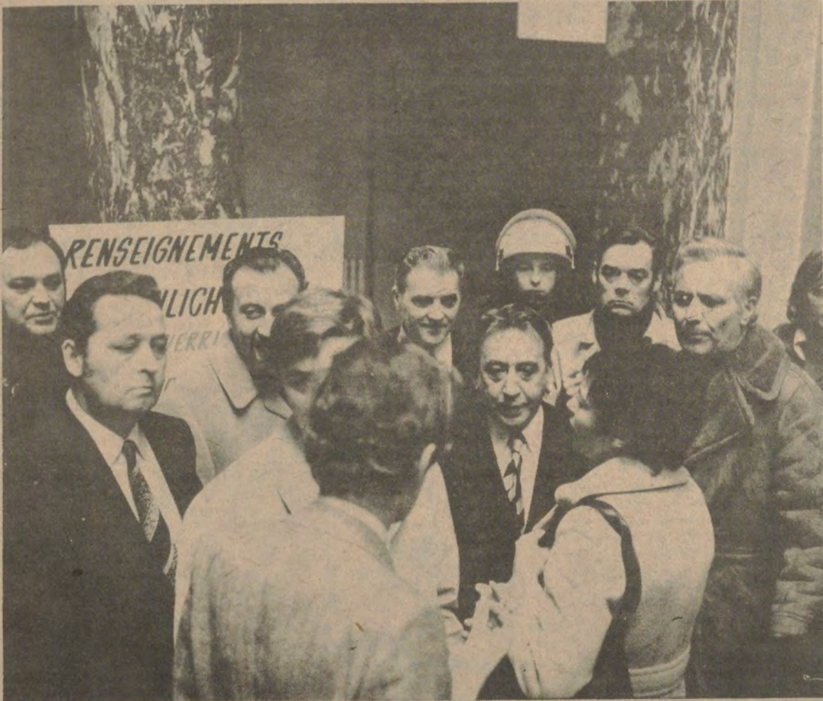
In het Schaarbeekse gemeentehuis: VU-parlementsleden in discussie met Nols (15 dec. 1974)