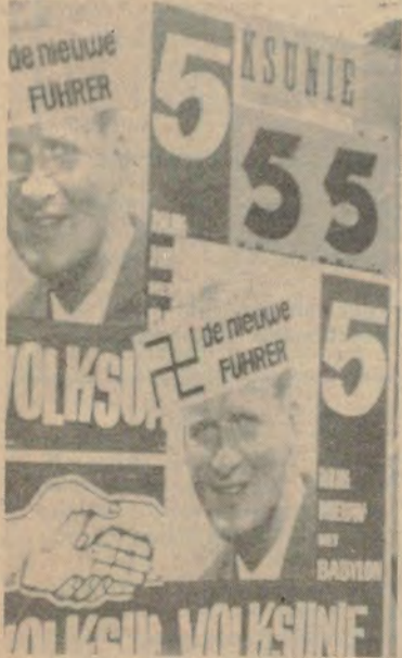
Met « De nieuwe führer » in 1965 brak de VU toch door in 1965.

Alle voornoemden hebben voor de Vlaamse zaak in het kader van de partij het beste van zichzelf gegeven. Hun functies melden we niet. In de dood is iedereen gelijk. We meenden ze speciaal te mogen groeten.